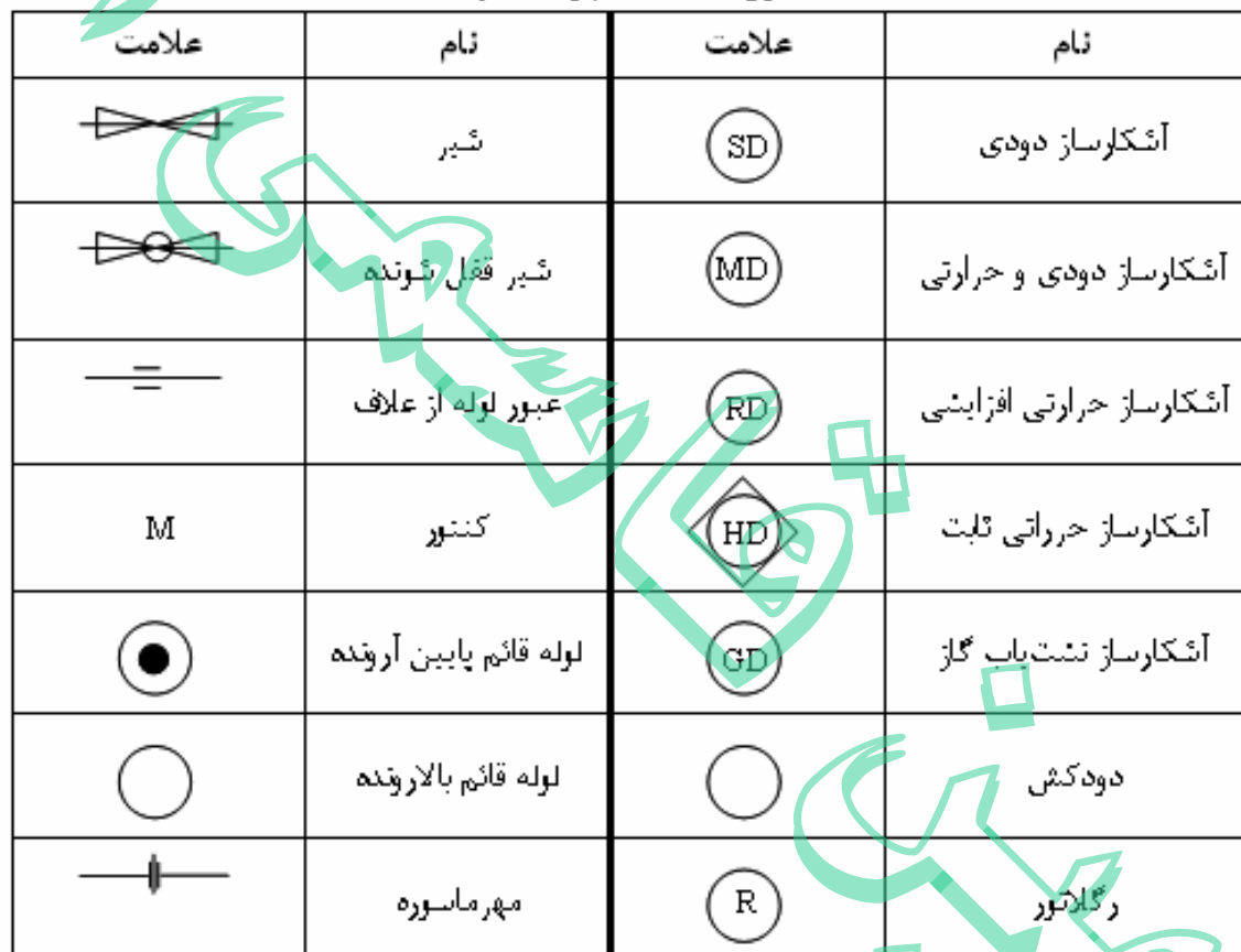
جدول ۴-۱ - علائم و اختصاری